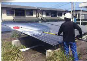
ソーラーパネル洗浄