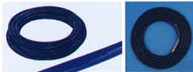
ウレタンジェットホース 高圧ゴムホース(WJ)