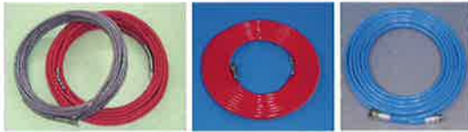
KKW/KKF PUウレタンホース(KKU) 樹脂ホース(KKN)