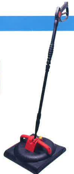
サーフェスクリーナー