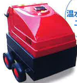
温水ボイラー ユニット

冷水高圧洗浄機に接続して使用します。 AC100V 電源。白灯油使用。 温水洗浄で効率アップ。