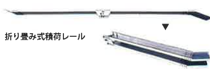
折り畳み式積荷レール