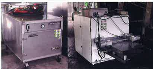
かご・パレット自動洗浄機